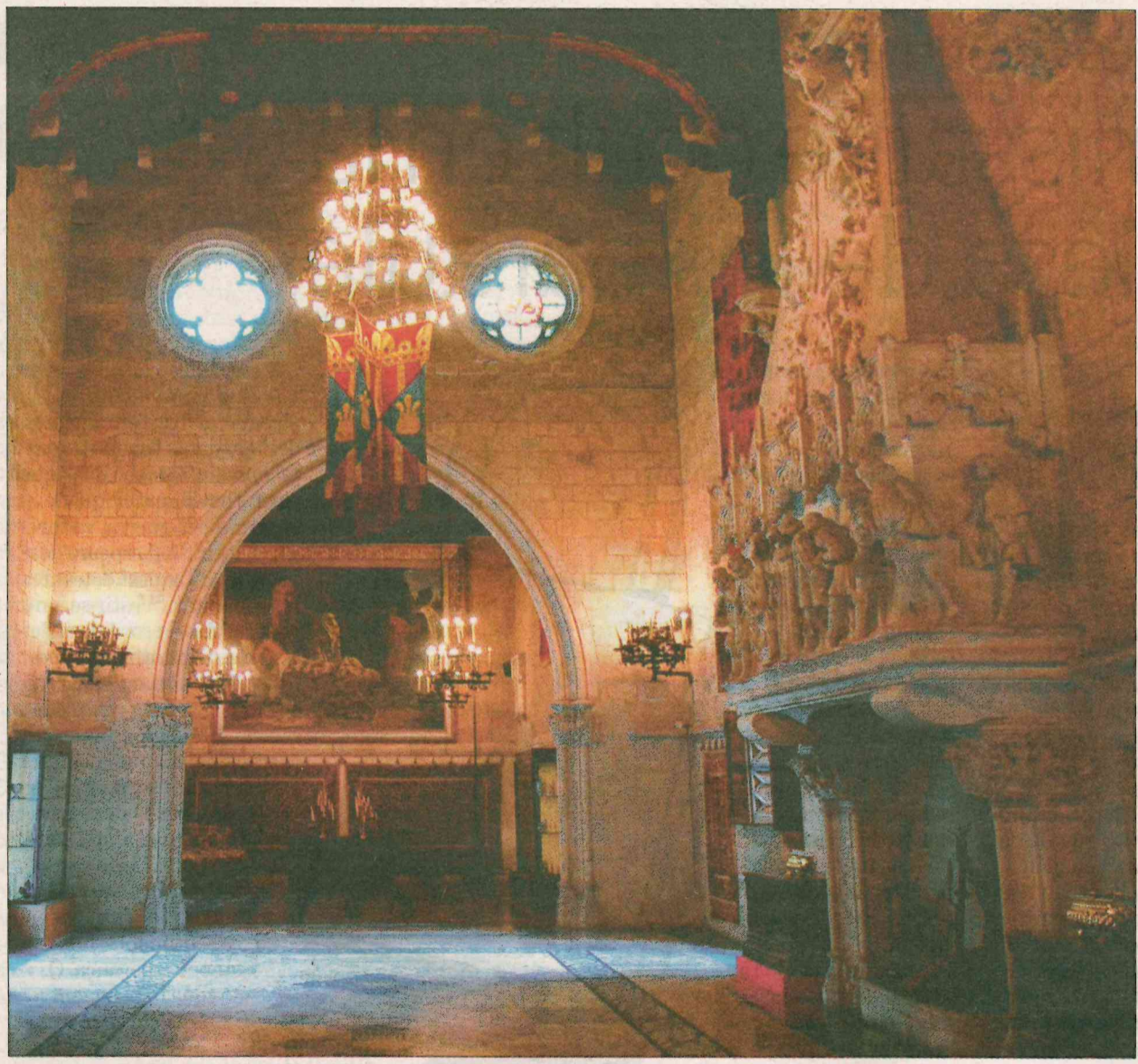
Interior del castell de Santa Florentina, en una imatge de l'opuscle 'Modernisme al Maresme'

EL RETORN • L'Ajuntament prepara un ampli pla de promoció aprofitant el ressò mediàtic de la sèrie