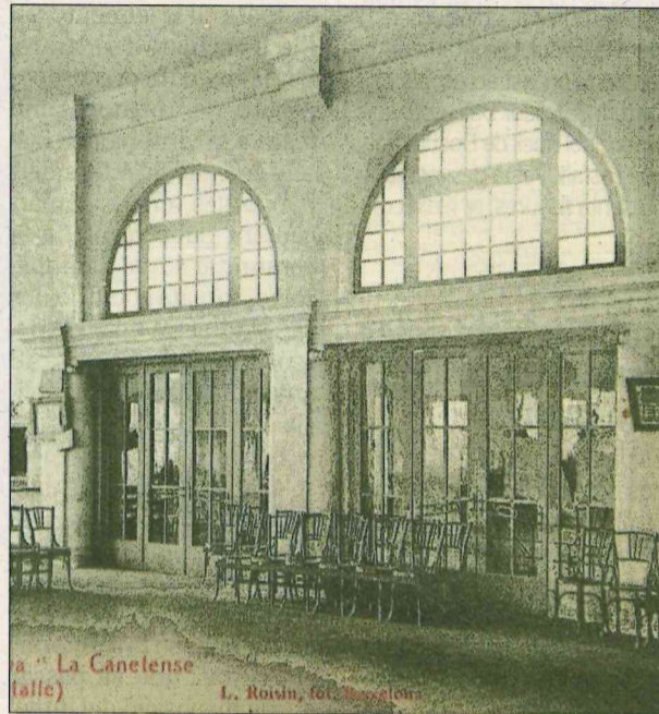
Detall de la Cooperativa La Canetense. ■ JORDI SOLER FONT

La Companyia de Canet consta com la cooperativa més antiga de l'Estat. Va ser creada el 1865. De les divergències en el si de l'entitat van sorgir les cooperatives La Constància i La Canetenca. Aquesta última, l'any 1919, compra un solar darrere de l'església i encarrega a l'arquitecte Rafael Masó que hi aixequi un nou edifici i, després de certes complicacions, s'aconsegueix inaugurar-lo el juny del 1923. L'espai començaria a funcionar anys després com a biblioteca i cinema, i també s'hi faria teatre. Amb motiu de les obres de reconstrucció de l'església després de la Guerra Civil, l'edifici també serviria com a temple religiós. Els anys setanta serien escenari d'una intensa activitat cultural promoguda pel grup El Canyer, vinculat a la mateixa cooperativa, que va propiciar l'arribada, el 1976, del grup Comediants, que acabaria esdevenint una de les icones de Canet i convertiria el municipi en un dels centres culturals més potents de Catalunya. L'edifici se-