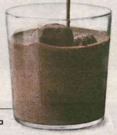
Xocolata freda 70% amb glaçons de xocolata

La Riera, 84-86 08301 Mataró (BCN) Tel. 93 755 24 40 info@patisseriauno.com www.patisseriauno.com