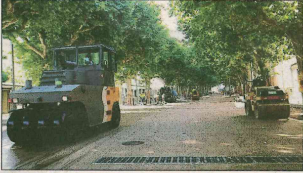
Les màquines acabant l'última capa d'asfalt