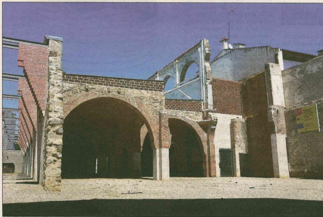
L'estat actual de l'edifici, a mitja reconstrucció ■ TERESA MÁRQUEZ

PROJECTE • Després d'anys d'entrebancs de tota mena, ja se n'ha consolidat l'estructura