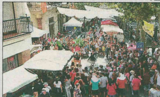
Ambient a la fira de l'any passat