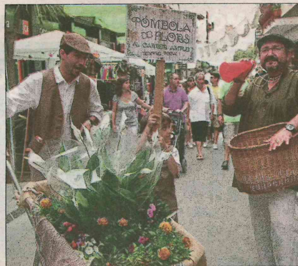
Participants en la passada edició de la fira ■ EL PUNT AVUI

aconseguir la recreació de l'ambient modernista l'organització fa una crida a la implicació dels ciutadans, als quals anima a vestir-se d'època, i també dels comercios, als quals insta a decorar les botigues i, en el cas de bars i restaurants, a oferir plats típics de l'època per dinamitzar encara més la fira. ■