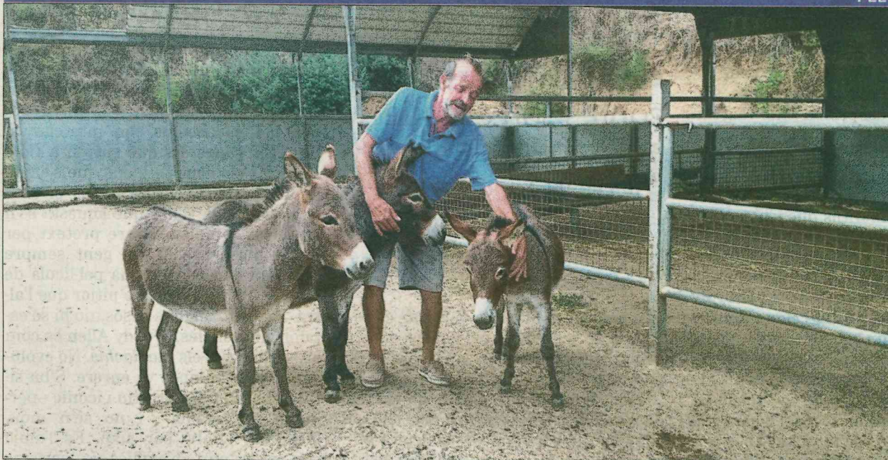
Un dels criadors, amb tres exemplars dels animals que crien a Arenys de Munt