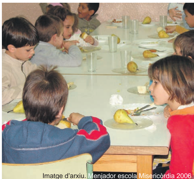
Imatge d'arxiu. Menjador escola Misericòrdia 2006

Trobareu més informació al web del Consell Comarcal del Maresme i al document elaborat per l'Àrea d'Educació de l'Ajuntament, que és accessible des del web municipal.