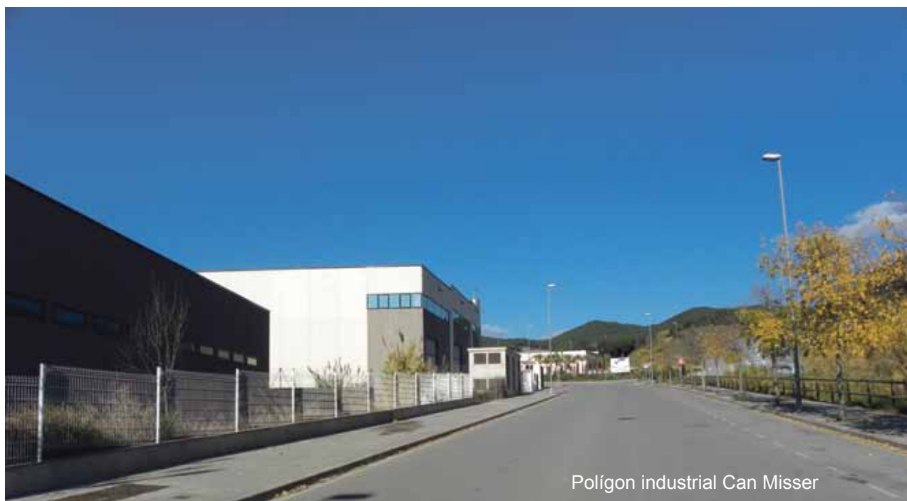
Polígon industrial Can Misser