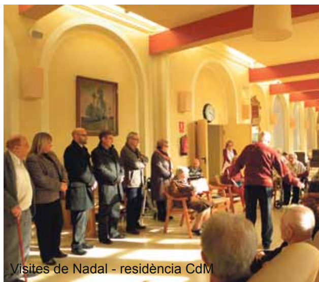
Visites de Nadal - residència CdM