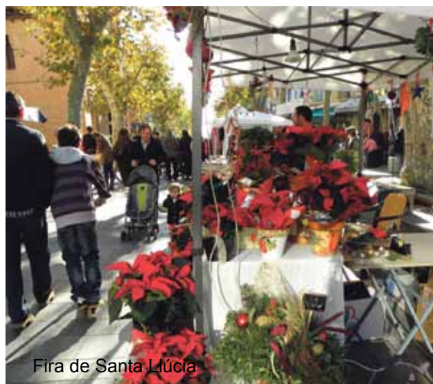
Fira de Santa Lúcia