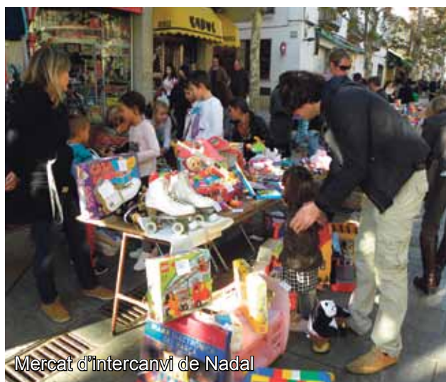
Mercat d'intercanvi de Nadal