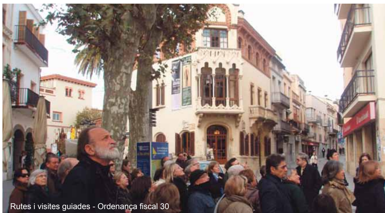
Rutes i visites guiades - Ordenança fiscal 30