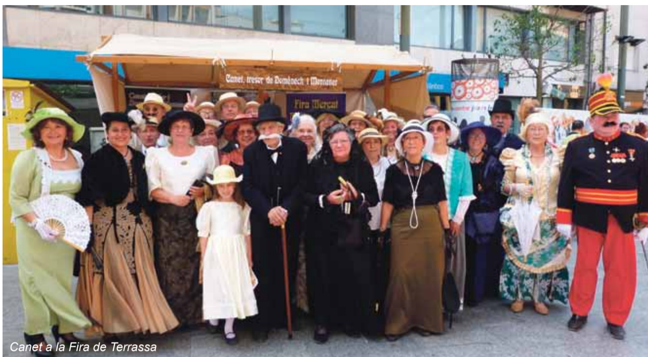
Canet a la Fira de Terrassa