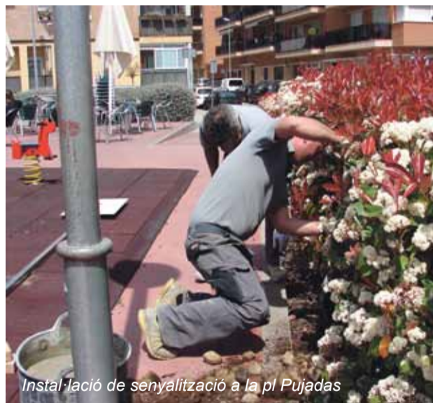
Instal·lació de senyalització a la pl Pujadas

de millora. Així ara l'Ajuntament pot prioritzar les accions que cal fer.