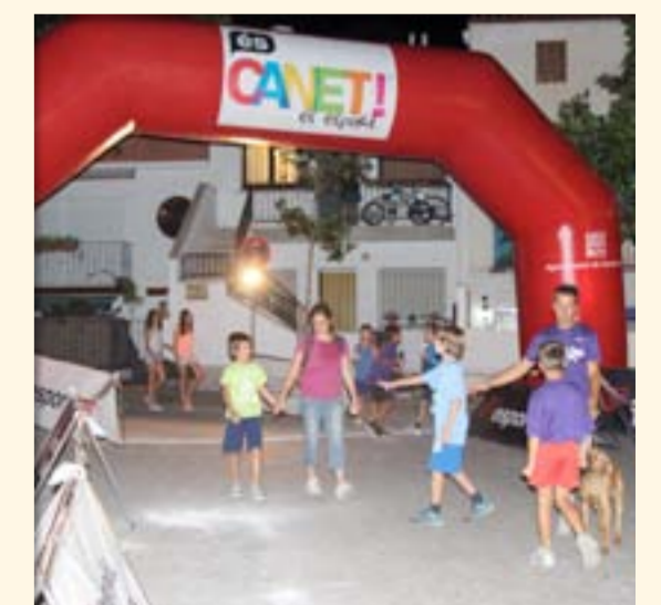
Nocturna de Canet