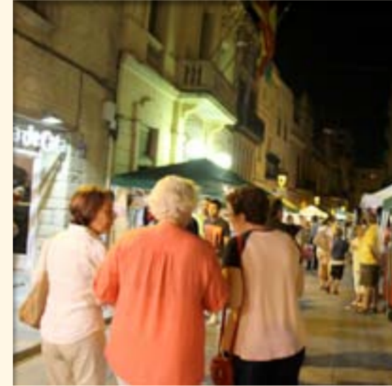
Comerç al carrer