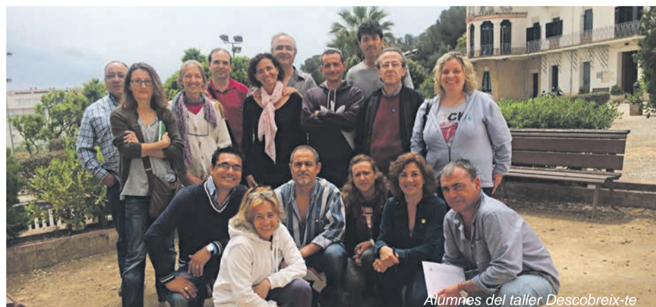
Alumnes del taller Descobreix-te

La formació oferta però, és molt més extensa. Aquí hem d'afegir cursos com el de Gestió administrativa, comptable i tributària per a empreses i emprenedors , o els seminaris que oferien claus per convertir una idea en negoci.