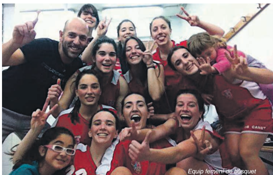
Equip femení de bàsquet