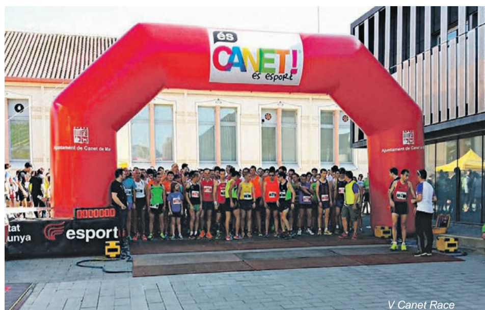
V Canet Race