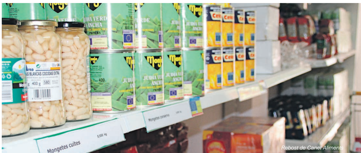
Rebot de Canet Aliments