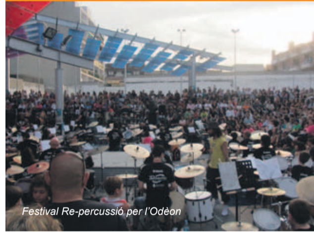
Festival Re-percussió per l'Odeon