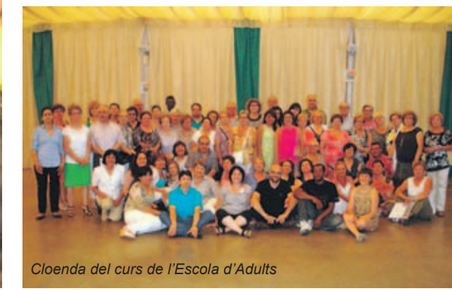
Cloenda del curs de l'Escola d'Adults

L'actualització i el detall de tots els actes i cursos, la trobareu a les cartelleres d'informació d'activitats repartides pel poble i als canals de comunicació de l'Ajuntament, la Guia Activa en suport paper i el web municipal, als apartats de l'agenda i formació.