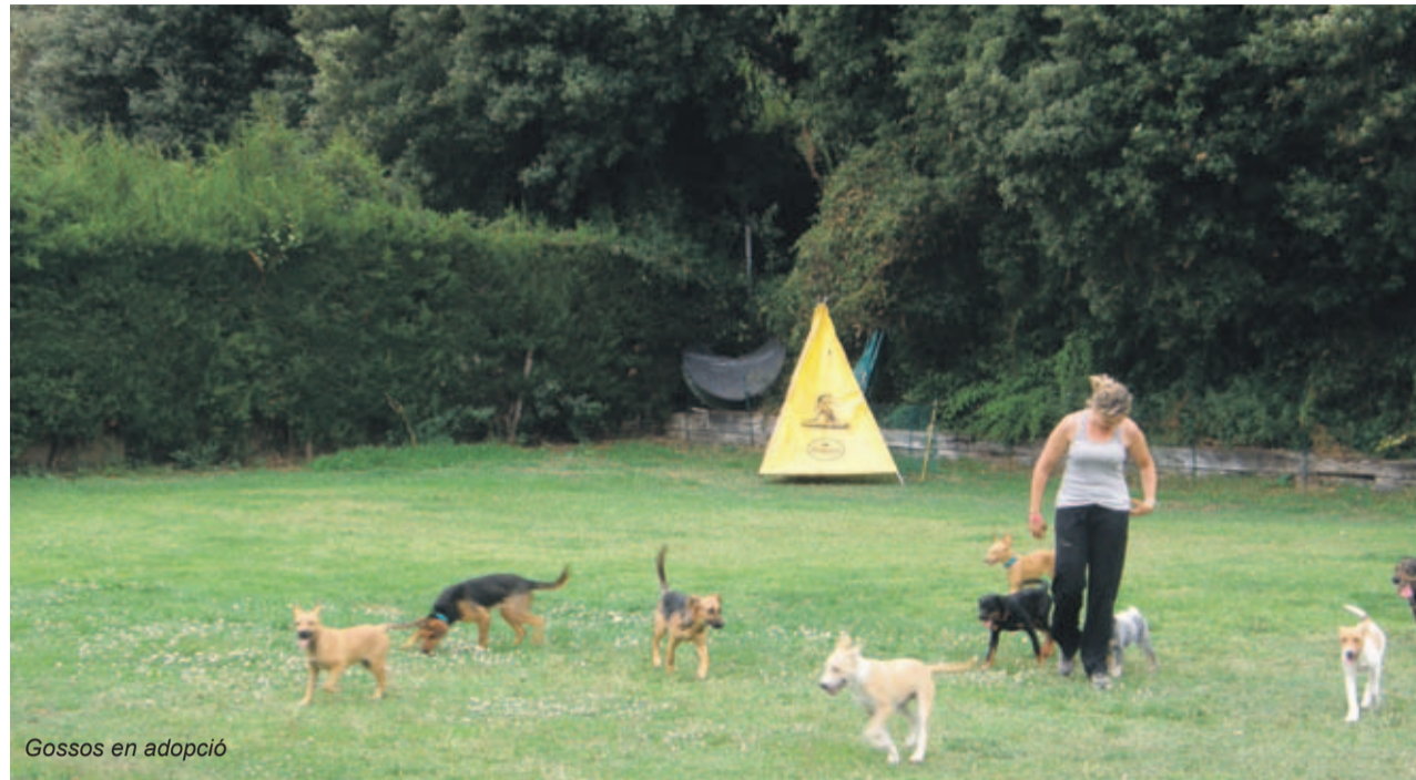
Gossos en adopció