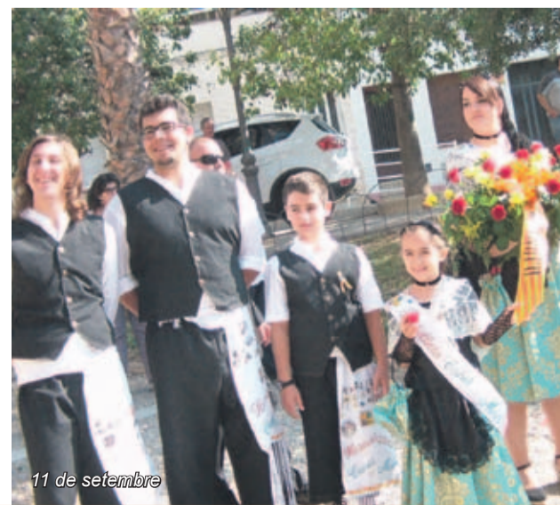
11 de setembre