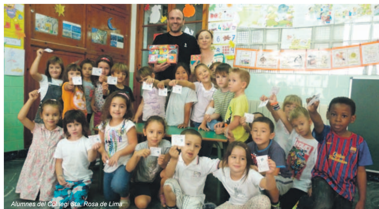
Alumnes del Col·legi Sta. Rosa de Lima