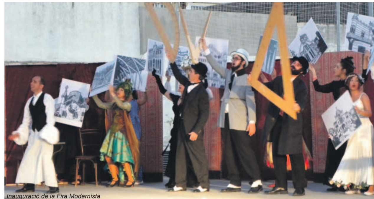
Inauguració de la Fira Modernista

Institut, Comediants i l'Ajuntament renovent el conveni de col·laboració