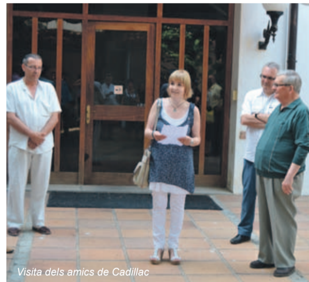
Visita dels amics de Cadillac