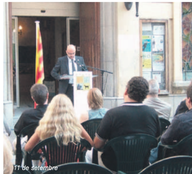
11 de setembre