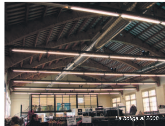
La botiga al 2008

Naus interiors. Pel que fa a l'espai central que dona a la riera Pinar i al passeig de la Misericòrdia,