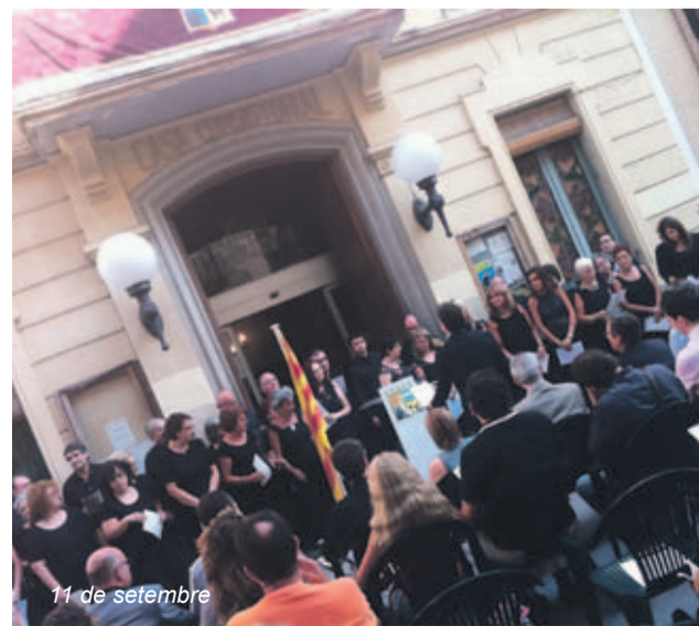
11 de setembre