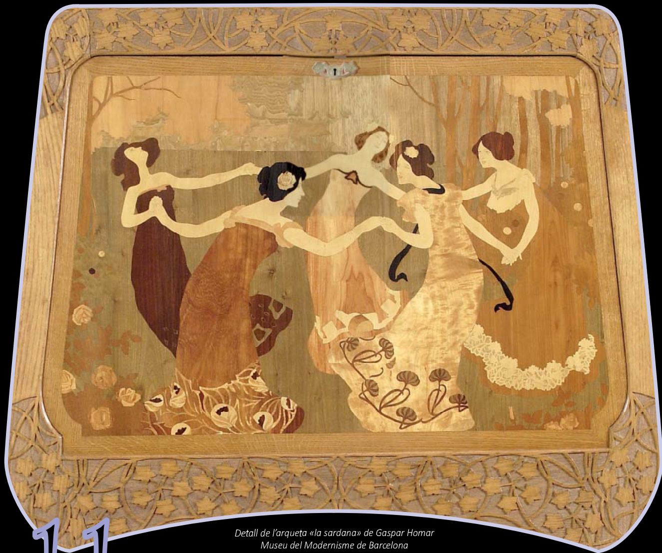
Detall de l'arqueta «la sardana» de Gaspar Homar Museu del Modernisme de Barcelona