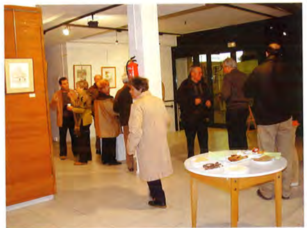
Inauguració de l'exposició col·lectiva de Nadal 23/12/04