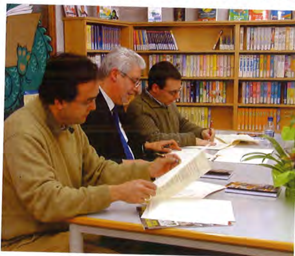
El conveni l'han signat, el 23 de desembre, l'alcalde, el regidor de Comunicació i el president d'Edicions Els 2 Pins. Aquesta signatura s'ha inclòs en l'acte organitzat pels 2 Pins, on presentaven el llibre "120 anys de premsa a Canet" i el número 100 de la revista Àmbit.

Encara s'està en fase de muntatge. Després ens tocarà explicar-vos-ho a tots i totes perquè no s'exclouï ningú que tingui interès a participar-hi. De moment, aprenuem-nos el nom. Tècnicament parlem d'una W-LAN, una xarxa local sense fils. Només ens caldrà un ordinador connectat a una petita antena que rebrà el senyal d'un dels punts d'accés que s'estan instal.lant en espais estratègics de la població. Podrem participar en fòrums d'opinió, compartir fitxers, imatges, jocs ... Una intranet ciutadana, una nova eina de comunicació. El futur.