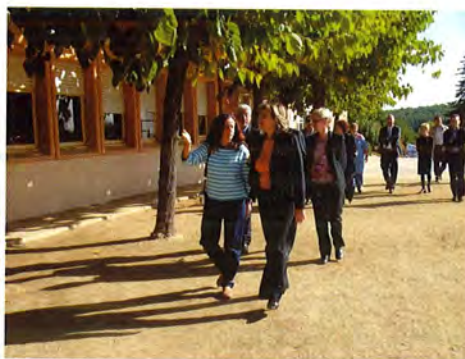
La consellera visita l'Escola Misericòrdia