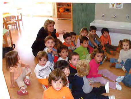
La consellera amb infants del Palauet

Els equips directius i els mestres dels dos centres van rebre i acompanyar la consellera per les instal·lacions i van mantenir reunions amb ella i amb els representants municipals