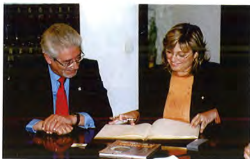
Moment de la signatura al Llibre d'Honor de l'Ajuntament

El 29 d'octubre va ser a Canet l'Honorable Senyora Marta Cid, consellera d'Educació de la Generalitat de Catalunya.