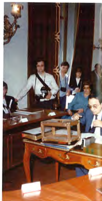
Imatge d'un ple dels anys 80 amb el primer alcalde de la democràcia, Antoni Cruanyes

Enguany s'han acomplert 25 anys des que la democràcia es va tornar a instaurar a l'Estat espanyol, des que es va tornar a instaurar als municipis. Un quart de segle des que els ciutadans de Canet van poder tornar a escollir lliurement els regidors que havien d'ocupar una de les butaques de la sala de plens. És per això que l'Ajuntament de Canet de Mar no ha volgut deixar passar aquesta efemèride i el passat diumenge 14 de novembre es van commemorar els 25 anys d'ajuntaments democràtics amb un acte institucional a l'aula magna de l'Escola de Teixits de Punt de Canet.