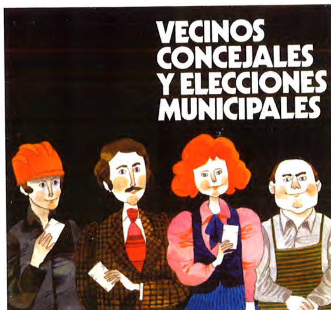
Portada d'un fulletó explicatiu del funcionament dels ajuntaments democràtics editat per l'Institut de Estudios de la Administració Local

matèria pressupostària, les xifres de fa 25 anys no tenen res a veure amb les d'ara. Un aspecte que va voler exemplificar dient que fa 25 anys el pressupost era de 64 milions de pessetes, mentre que ara és de 1.500. És per això que l'alcalde va voler recordar que el poble ha canviat molt en tots els aspectes i va reclamar que els organismes superiors destinin més recursos per als ajuntaments.