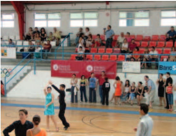
Segon trofeu de ball de Saló

Les pistes poliesportives del c/ Catalunya han vist passar moltes generacions de canetencs per les seves instal·lacions. Donada la seva bona ubicació, aquesta tendència no canviarà, tot i que en un futur pròxim es construeixin unes noves instal·lacions esportives al polígon industrial.