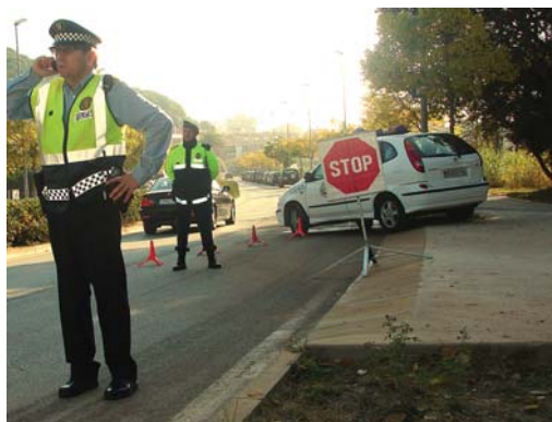
Els agents fan controls periòdics a la via pública.

Control fet entre el 2 i el 14 d'octubre