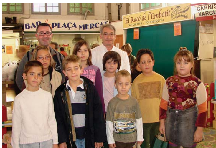
Alguns dels guanyadors en una foto de grup el dia del lliurament de premis