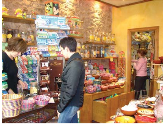
Temptacions és un dels comerços adherits al projecte

L'Ajuntament, a través de les àrees d'Educació i Infància i de Promoció Econòmica, i l'Institut Lluís Domènech, han signat uns convenis de col·laboració amb empreses i comerços locals, perquè alumnes de l'institut puguin estar unes hores a la setmana treballant i aprenent, per tant, el funcionament del món laboral.