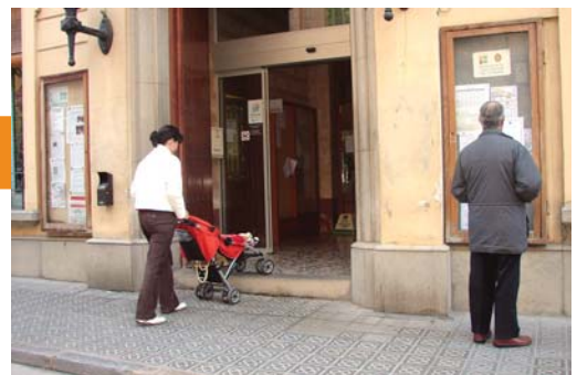
L'Ajuntament invertirà al 2008, 60.000 euros per millorar l'accessibilitat als edificis municipals

Entre els projectes que gestionarà l'Oficina, hi ha els habitatges dotacionals, pisos de lloguer per a joves i gent gran amb pocs recursos econòmics. Fa temps que l'Ajuntament hi està treballant. Sabem que s'ubicaran a tocar de la ronda Francesc Parera i al carrer Romaní i tenim un projecte que determina com seran. Ara ja podem dir que es començaran a construir aquest any que comencem. Canet forma part dels pobles que s'han afegit al nou model de contractació d'habitatges protegits que dirigeix la Diputació i que s'encarregarà de fer tots els tràmits necessaris perquè tiri endavant l'adjudicació de les obres dels pisos. La decisió serà de l'Ajuntament, però ens facilitaran tota la tasca burocràtica i de gestió que un procés d'aquestes característiques implica.