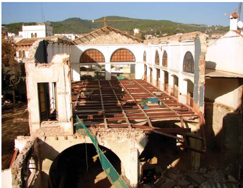
L'edifici després de l'accident