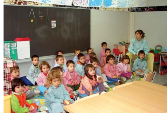
Nens i nens del CEIP Turó del Drac