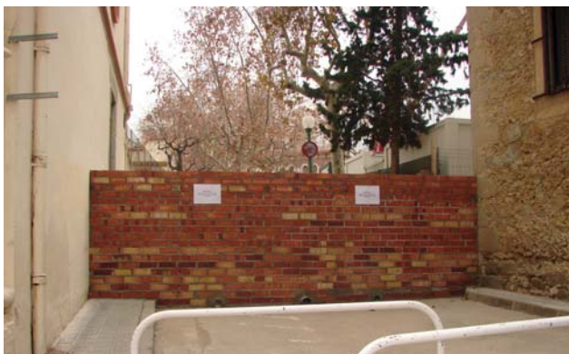
Tancament de seguretat

Cost total de les obres de rehabilitació: 3.961.811 d'euros cost 1a fase 1r lot (obres que s'estaven duent a terme des del febrer): 1.363.551 euros