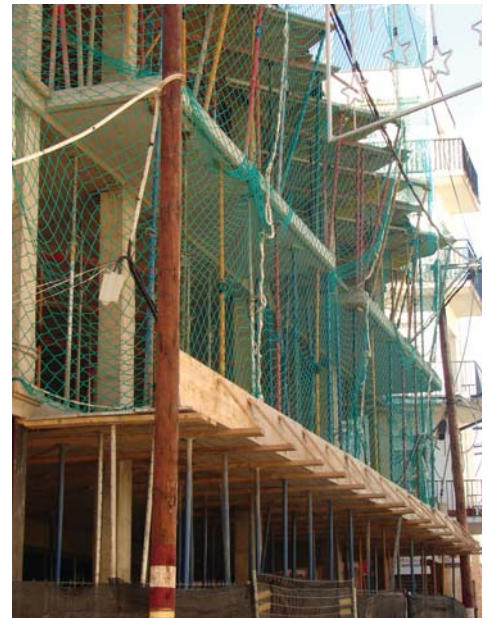
L'objectiu principal és el manteniment de la identitat del poble

Això no vol dir que els pisos han de tenir a partir d'ara 90 metres quadrats, sinó que es garanteix que seran proporcionals a