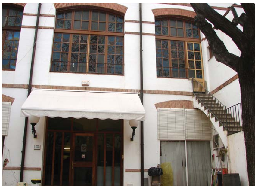
Façana interior dels Serveis Tècnics

L'Ajuntament rebrà, durant aquest primer semestre de 2008, un ajut econòmic que es destinarà a la reforma i la rehabilitació de l'edifici del carrer de la Font, on s'ubiquen els Serveis Tècnics municipals i que suposaran un 90% del cost total de l'obra. El tinent d'alcalde d'Urbanisme, Òscar Figuerola, ha rebut la confirmació d'aquest