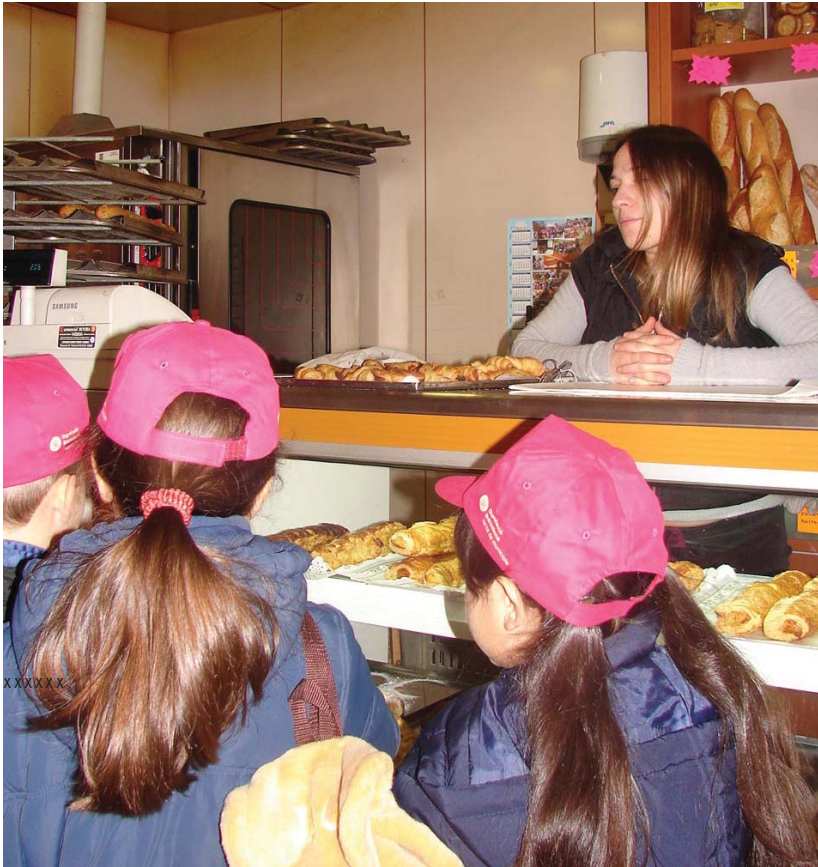
Els alumnes pregunten directament als venedors

Com ja va fer l'any passat, la Xarxa de Mercats de la Diputació de Barcelona col·labora amb els mercats municipals per convertir-los en un referent del comerç de proximitat.