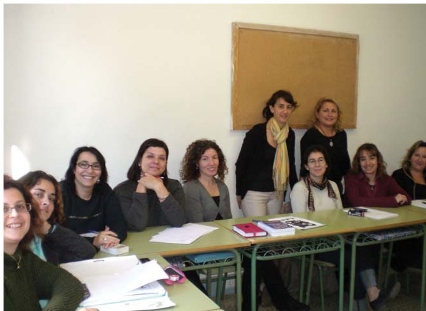
Alumnes del curs d'anglès

cursos no és la formació, sinó aconseguir la incorporació laboral de les persones sense feina i la millora dels qui ja la tenen. Les