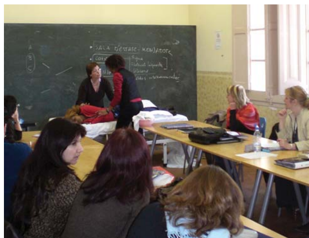
Alumnes del curs de geriatria

persones inscrites a la Borsa de Treball reben l'assessorament del personal tècnic de Promoció Econòmica i es poden beneficiar per tant, de les accions sol·licitades a la Diputació de Barcelona en matèria de formació i inserció.