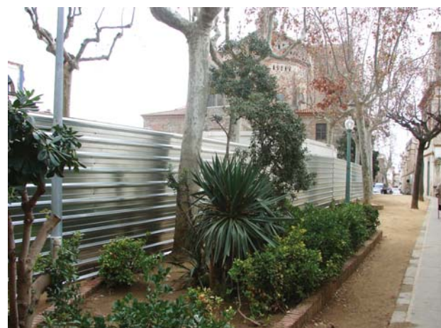
Una gran tanca de seguretat separa l'espai de l'obra i facilita el pas de les persones per la plaça Colomer

L'u per cent cultural és la partida mínima que la Generalitat reserva als seus pressupostos per invertir en patrimoni cultural i creació artística. Que s'hi inclogui el projecte de l'Odèon ens demostra que la Conselleria de Cultura i Mitjans de Comunicació considera Canet com a molt important per a la difusió i el manteniment de la creació cultural a nivell nacional.