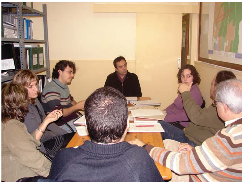
Reunió de l'equip tècnic de l'Àrea

a les oficines d'Obres i Serveis, Disciplina Urbanística i Habitatge i Accessibilitat. En aquesta mateixa planta també s'hi ubicarà gran part de l'Arxiu Municipal.