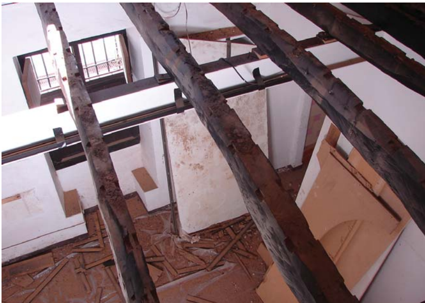
Interior de la masia

Educació, municipis i República: 159 persones Fer arxiu: bocins d'història: 105 persones Rafael Masó i Valentí (1880 – 1935): 686 persones Transparències: 58 persones Bonsais: 550 persones Pintura Golfa: 300 persones L'Arquitectura moderna a l'Amèrica Llatina. 1950 – 1965: 197 persones Nens, monstres, objectes i mestres: 255 persones Motius marians i mariners: 778 persones