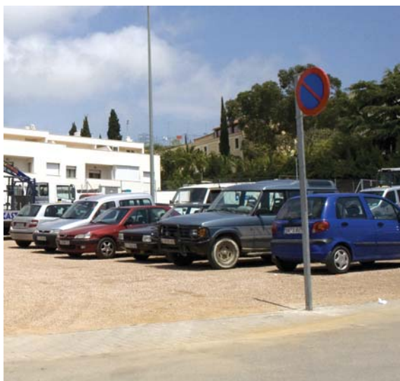
Aparcament del carrer Carles Carqués

L'Ajuntament va obrir també el passat mes de maig un altre aparcament gratuït, en aquest cas a la zona de la llar d'infants municipal, El Palauet, a tocar del Santuari de la Misericòrdia, concretament al carrer Carles Carqués i Martí. Aquest aparcament té capacitat per a una vuitantena de vehicles.