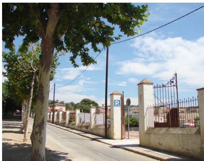
Aparcament de La Carbonella